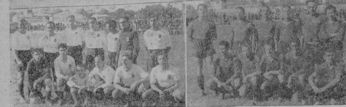
He aquí a los equipos del «Constancia» y el «Mallorca», minutos antes de dar comienzo al encuentro de ayer tarde, en «Es Cos», posando para «CORREO DE MALLORCA».