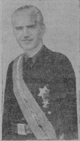
El Sr. Serrano Suñer, Ministro de Asuntos Exteriores.

de todos los pueblos que hablan la lengua de Cervantes y sigue con el máximo interés y actitud de aquellos países.