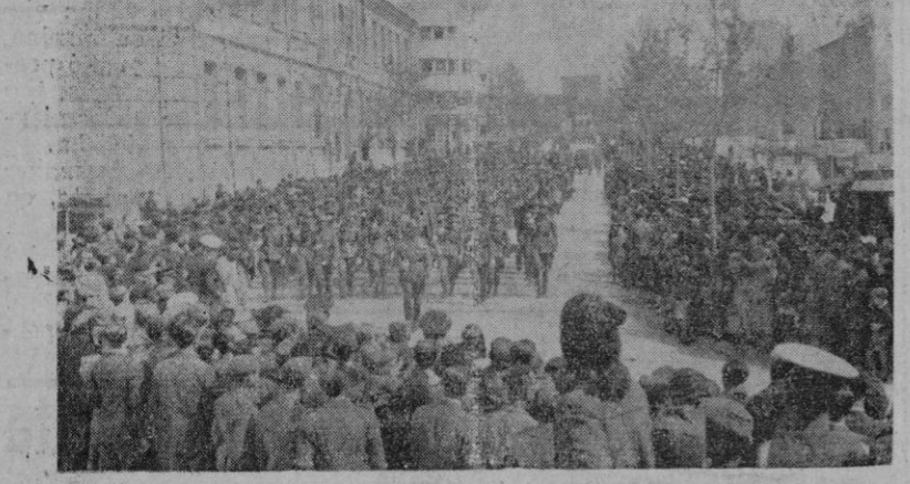
El paso de las formaciones de Infantería