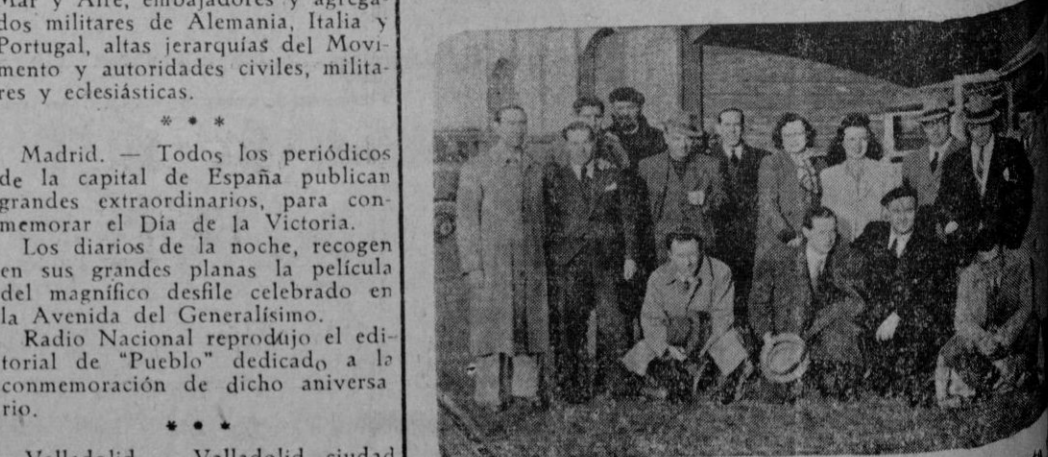
Los jugadores y Jerarquías nacionales de pelota antes de llegar a nuestra ciudad, pesaron al acompañados de los que les recibieron en MALLORCA.

LA CIUDAD UNIVERSITARIA DE MADRID SE TROYE CON LOS CUCOS OBTENIDOS EN EL TERCIO DE MAYO.