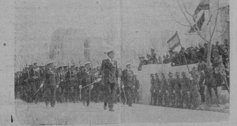
La sección de marinería del 'Júpiter' desfila ante la tribuna