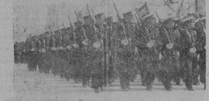
La Infantería de Marina