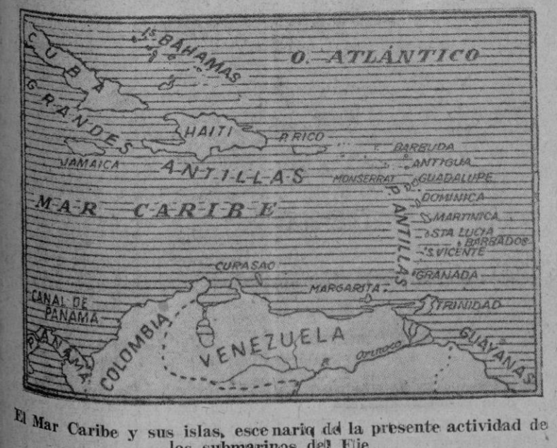
El Mar Caribe y sus islas, escenario de la presente actividad de los submarinos del Eje

Este mar interior americano, casi de extensión igual al Mediterráneo europeo, ha sido invadido. Los hundimientos continúan, a pesar de la caza emprendida contra los invasores por unidades ligeras, aeroplanos y submarinos. Todo el mundo se pregunta dónde se encontrarán las bases del enemigo y si los alemanes habrán creado puntos de apoyo en las dilatadas costas de América Central o del Sur, o si estos submarinos serán abasteci-