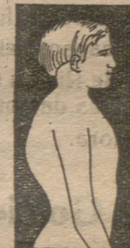
MAL DE POTT