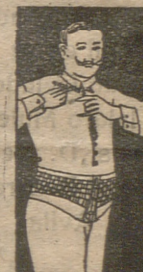
FAJA DE CABALLERO