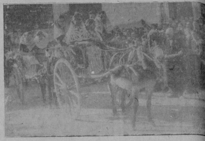
En Lluchmayor siguiendo el tradicional costumbre de la fiesta de San Antonio Abad revivió gran esplendor. La ción de caballerías vióse concurrir a ella, y a ella acudieron meros carros y carruajes adornados. En la foto se ve un grupo de jóvenes vistiendo el traje típico mallorquín.