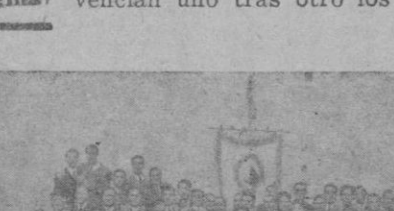
Asistentes a la Comunión general celebrada en noviembre último