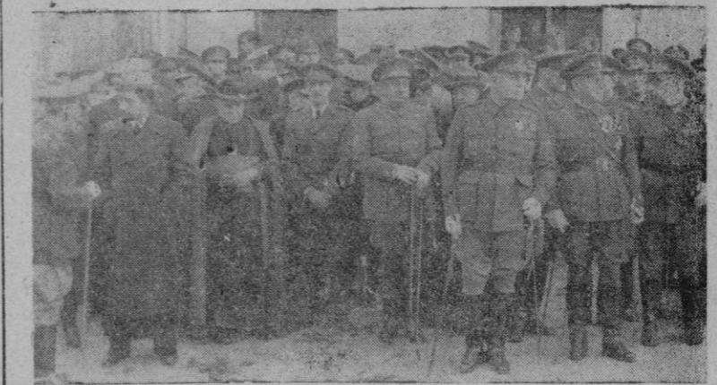
Las autoridades y jerarquías dis puestas a presenciar el desfile de las tropas

...CINAS: MORA, 3 ...LEFONOS: ...ACCION, 1973 ...MINISTRACION, 2853