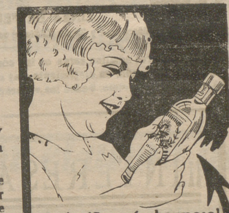
¡Qué niño más hermoso!

LA SOLEDAD.—Pompas fúnebres 3.—San Segundo.—30