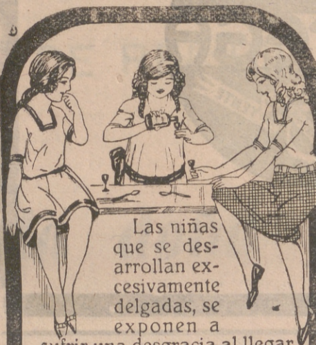
Las niñas que se desarrollan excesivamente delgadas, se exponen a sufrir una desgracia al llegar a la época de su transformación o cuando menos a quedar enfermizas e inútiles para toda su vida.

Se ha dispuesto el pase a la reserva al coronel de Artillería D. Manuel Arrañuel.