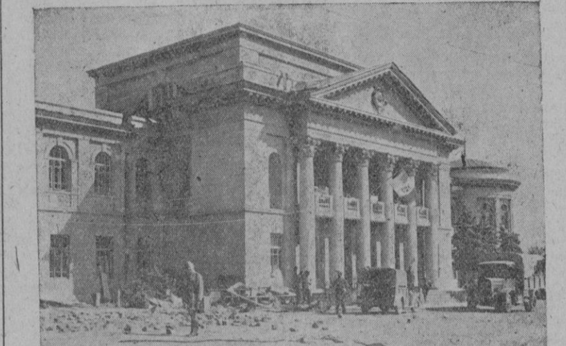
Frete oriental. — La bandera italiana ondea en el local de la G. P. U.