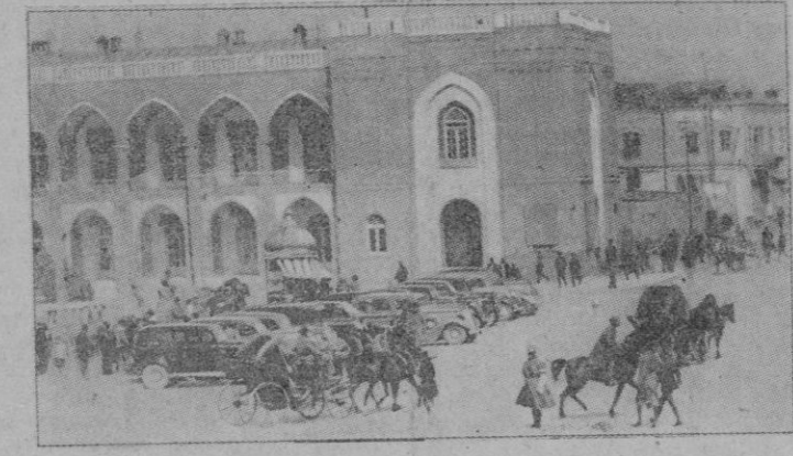
Teherán. — Casa Consistorial

En medio de una fértil llanura de la meseta persa se levanta la ciudad de Teherán, cuyo perímetro tiene cerca de 8 kilómetros y está cercado por un muro con torres y fosas. En el interior abundan las plazas, huertos y jardines y a contar del s.º XVIII fué hermosamente embellecida por los Shaas. Su población es de 150.000 habitantes.