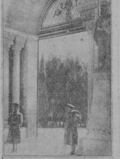
Entrada del Saadabad palacio del Shah