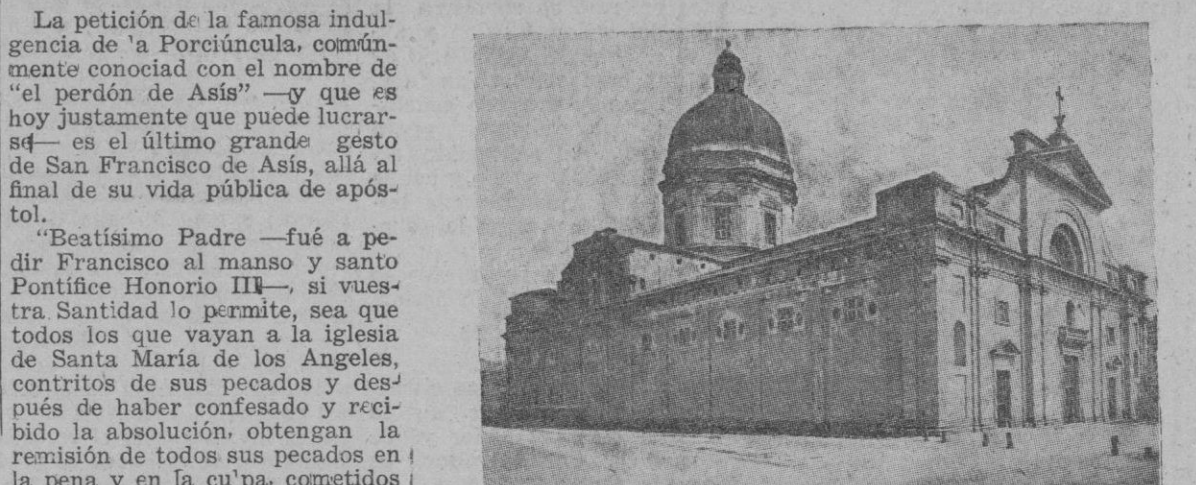
La basilica de Santa María de los Angeles que se levanta a la vera de la villa del mismo nombre en el valle que se extiende a los pies de Asís

Concedióla el Papa Honorio III a San Francisco de Asís a la vista de la iglesia de Santa María de los Angeles, la cual se conserva ahora en el interior de la actual basilica del mismo nombre