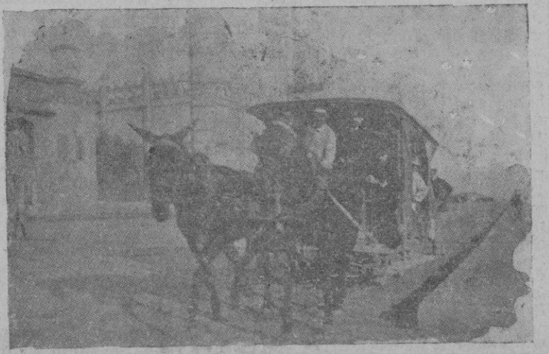
El antiguo tranvía de mulas, según un grabado publicado por la revista "La Roqueta"