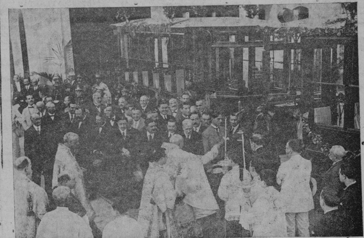
Fotografía de la bendición de los dos primeros tranvías eléctricos a cuyo acto asistieron los directores de la entonces naciente Compañía y autoridades