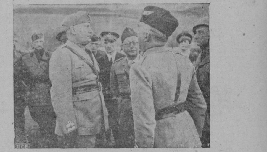
En vísperas del derrumbamiento griego: el Duce, en la zona de Berat