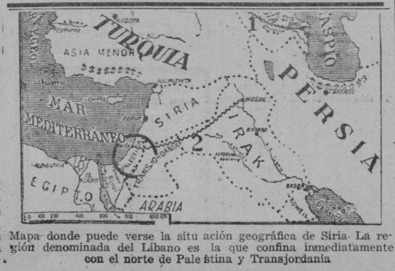
Mapa donde puede verse la situación geográfica de Siria. La región denominada del Líbano es la que confina inmediatamente con el norte de Palestina y Transjordania