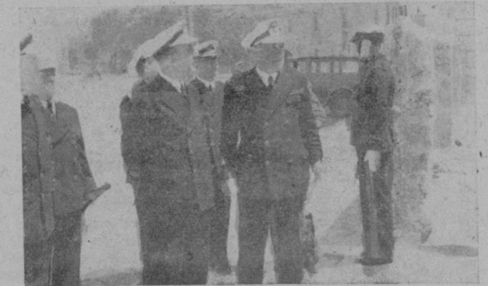
El Ministro de Marina con templando unas instalaciones de la Base de Palma

cos, en los terrenos ya adquiridos con tal fin en Cala Gamba (Coll d'En Rebassa). Las gestiones han obtenido satisfactorio resultado, y, D.m., pronto empezarán los trabajos para la construcción del edificio destinado a sanatorio. Celebramos poder dar esta noticia. Y, al darla, esperamos que no faltarán eficaces ayudas para que Mallorca pueda contar en breve con un establecimiento tan benéfico como el que va a fundar la benemérita Orden de San Juan de Dios.