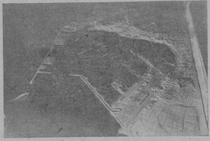
Vista de la maqueta que fué presentada ayer al Ministro de Marina en la Junta de Obras del Puerto