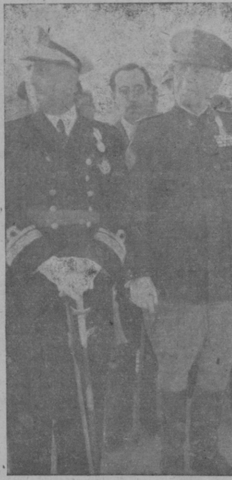
El Ministro instantes después de desembarcar en Palma