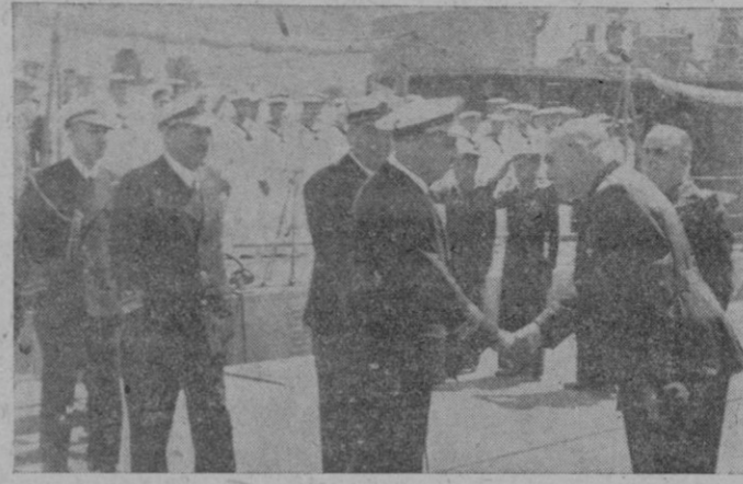
El Alcalde de Sóller da la bienvenida al Ministro al desembarcar éste en el puerto de aquella ciudad