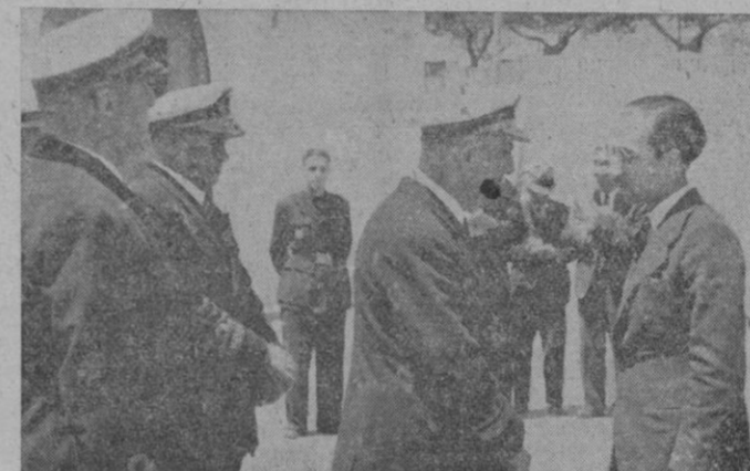
El Ministro hablando con el Gobernador Civil en el puerto de Sóller