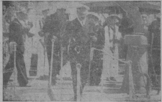
El Ministro al saltar a tierra a su llegada al puerto de Sóller