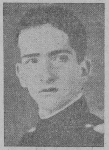
Pedro II, Rey de Yugoslavia

Después de las manifestaciones populares que motivaron el cambio de Gobierno, el joven Rey Pedro II decidió asumir el Poder. En la noche del 26 al 27 del corriente, las tropas de la guarnición, la gendarmería, la guardia y las secciones motorizadas ocuparon los Ministerios y edificios públicos, las carreteras de Belgrado y los puentes. A las seis de la mañana las fuerzas armadas prestaron juramento de fidelidad al nuevo Rey. Al mismo tiempo, éste hizo radiar una proclama en la que anunciaba su subida al Trono y su decisión de confiar al General Simovich la formación de otro Gobierno. En el transcurso del día, Simovich conferenció con los representantes de los partidos po-