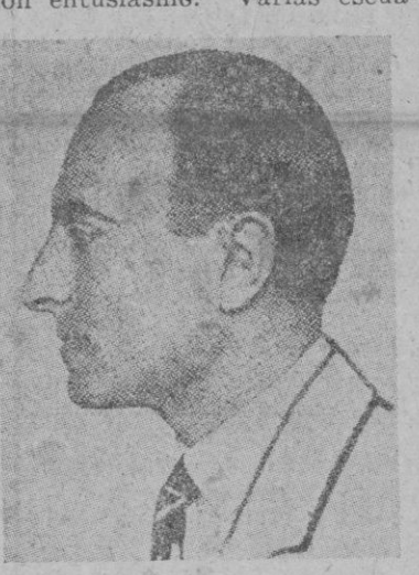
El Príncipe Pablo, co-Regente de Yugoslavia hasta el advenimiento de Pedro II al trono

De fuente diplomática se afirma que 1.250.000 hombres se