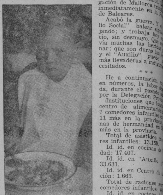
He a continuación, en números, la labor realizada, durante el pasado año, por la Delegación Provincial de Instituciones de Fomento, centro de alimentación infantil, 7 comedores infantiles, 11 más en la provincia, más de hermandad en más en la provincia.

ciudadana: se atendía, por deseo expreso del Caudillo, a los que, fugitivos del infierno rojo, llegaban a la isla; y, sobre todo, se preparaba lo necesario para llevar pan y alimento a las regiones que iban a ser liberadas. Y fué cumplida la misión