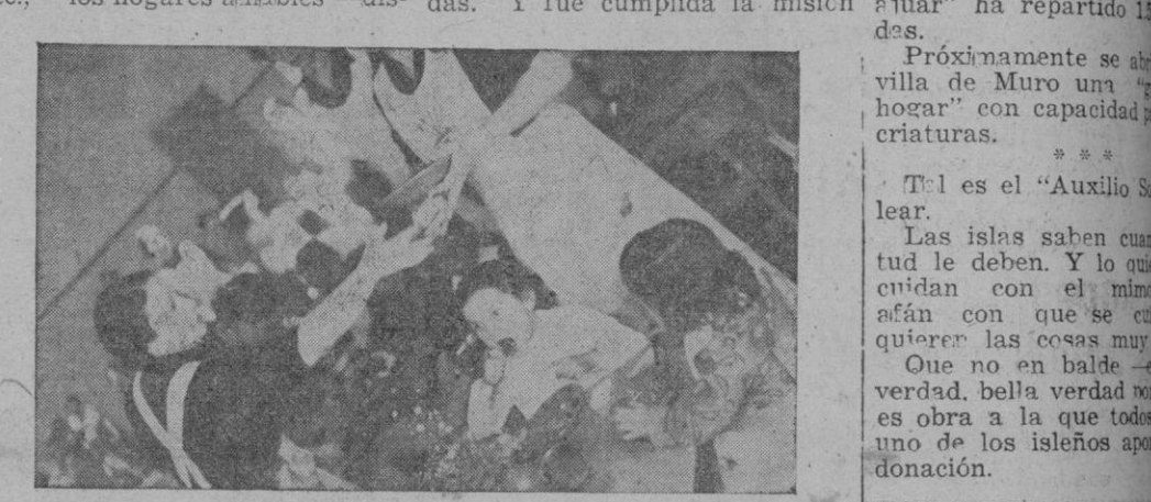
pensario, centro de alimentación, comedores infantiles, cocinas de hermandad... mostraron a todos una de las más bellas realidades de la España que renace con exactitud admirable: Valencia (capital y provincia) recibió todo de la tierra mallorquina; y Menorca, la isla hermana caída en el infortunio y la esclavitud,

Que no en balde —verdad, bella verdad— es obra a la que todos uno de los isleños aportaron su donación.