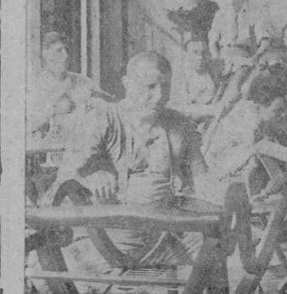
El taller de enrejado de sillones cuando estaba en plena actividad

Por simple curiosidad periodística, sin que nadie nos invitara