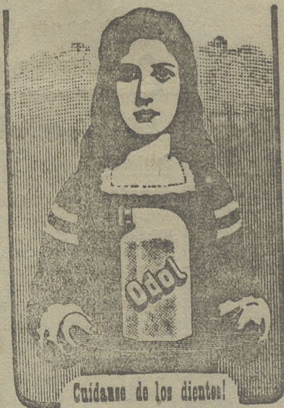
Cuidando de los dientes!

No descuide Ud. la higiene de la boca, y use siempre ODOL, que es el dentífrico ideal.