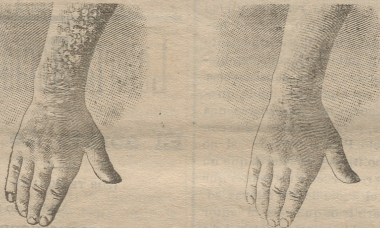
Antes de la curación Después de 15 días de tratamiento