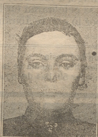
Después de 15 días de tratamiento