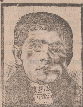
Perla de Navarra, Enero 1909.

Temperatura máxima á la sombra=8°0 Idem mínima=-4° Irradiación solar=36°0 Idem nocturna=-7°0 Temperatura en el vacío y á 2 metros del suelo.=45°0 Velocidad del viento en las últimas veinticuatro horas.=130 kilómetros. Evaporación en las id. id.=3°0 m. m. Agua recogida en el pluviómetro=>