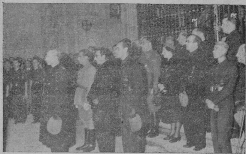
Alicante. — La Junta Política de Falange Española Tradicionalista y de las JONS recibe, en la iglesia de San Nicolás, el féretro que contiene el cuerpo de José Antonio.