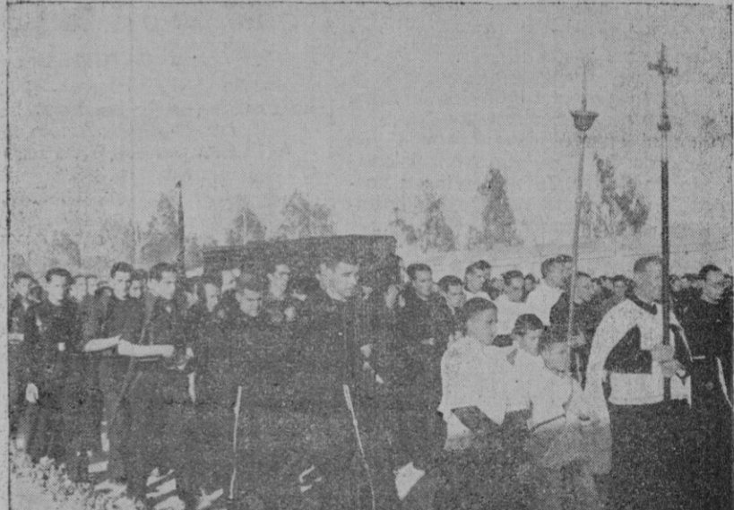
Alicante. — El féretro que contiene los restos de José Antonio y su cortejo fúnebre en marcha hacia Alicante.