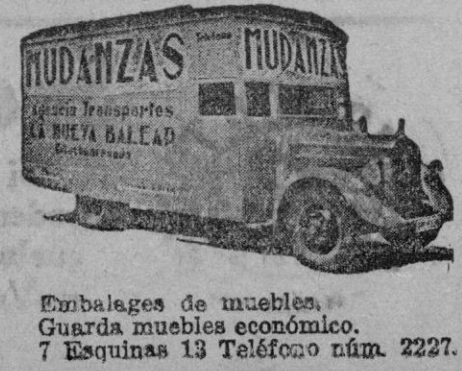
Embalajes de muebles. Guarda muebles económico. 7 Esquinas 13 Teléfono núm. 2227.

Otros noventa pasajeros eran ingleses y emigrantes procedentes de Alemania y países del centro de Europa. El hundimiento del "Simon Bolívar" ha causado gran emoción en Holanda. Otras noticias... PRISIONEROS ALEMANES FALLECIDOS... Londres. — Se ha publicado una lista conteniendo los nombres de nueve prisioneros alemanes que han fallecido.