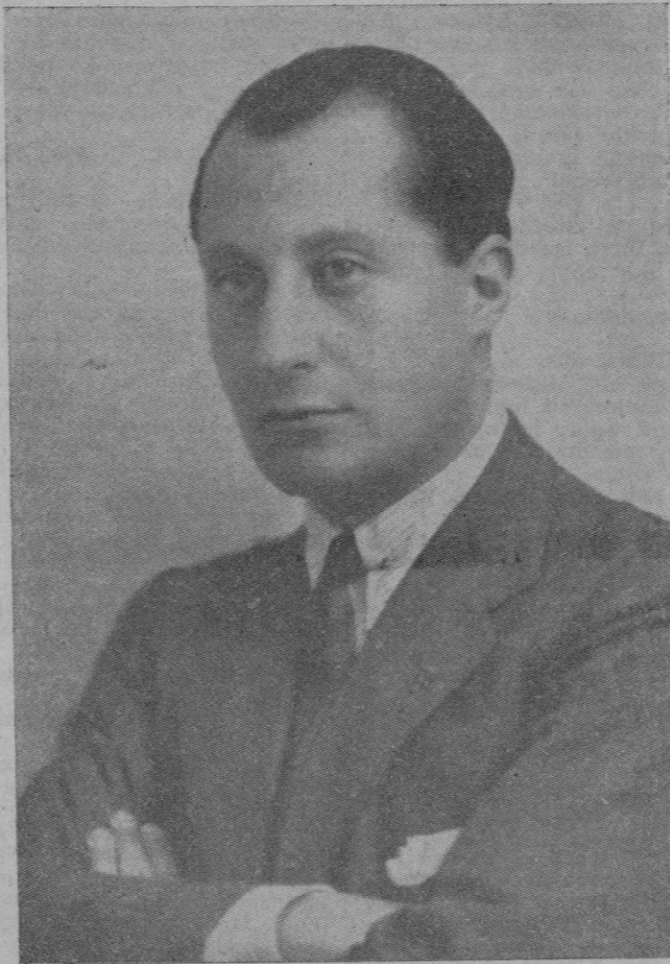
¡Bendita sea la Falange si ella nos lleva a morir por España!

Era viernes y 20 de noviembre. La descarga, magnífica taladró la mañana lluviosa y retumbó desgarradora en dos celdas cercanas. La de Miguel, a pocos metros del lugar de la ejecución, y la que ocupaban