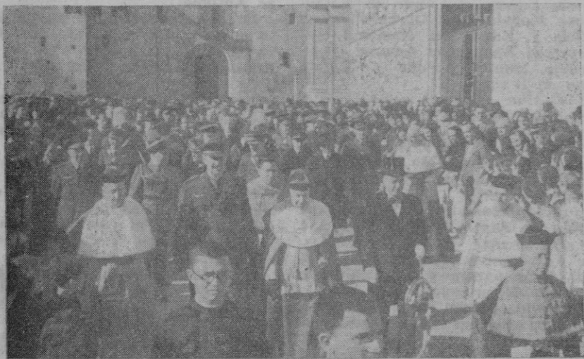
El Excmo. Sr. Arzobispo-Obispo, al salir de la Catedral, acompañado del Comandante General y del Gobernador Civil.