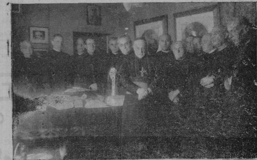
Un grupo de párrocos, con el Excmo. y Rdm. Sr. Arzobispo-Obispo de Mallorca, después de entregar a éste los sobres con las felicitaciones y los donativos para contribuir a los gastos de construcción de las nuevas parroquias de Palma.

(Continúa al final de la primera columna de la segunda página)