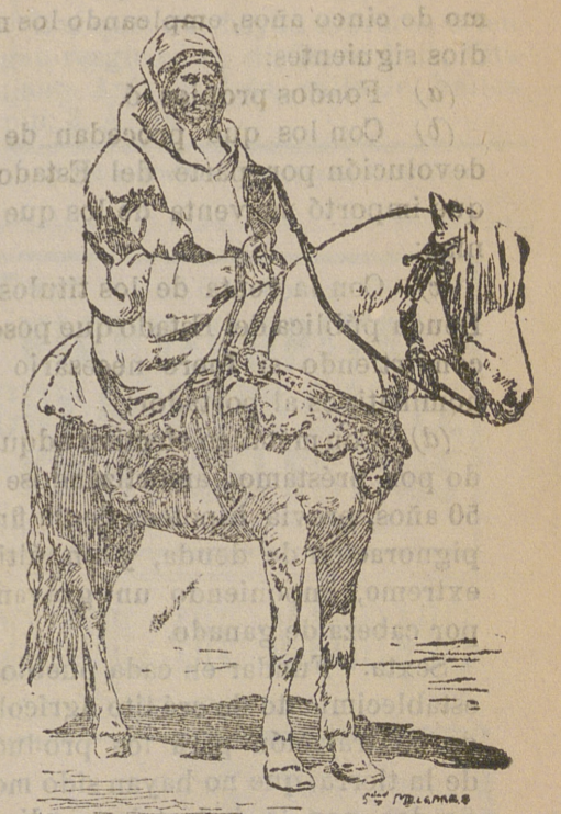
Muley Hafid, nuevo sultán de Marruecos.