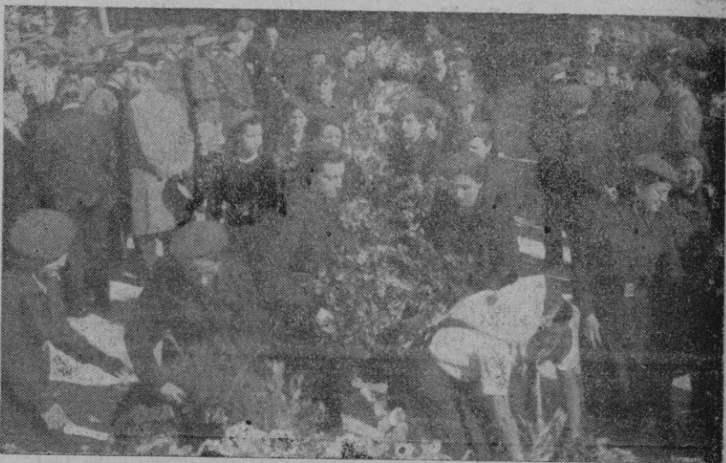
Palma entera acudió a la Cruz del Mirador.

Así fué en nuestra Ciudad el Día de los Caídos. Esta fué la conmemoración. Sencilla. Austera. Perfumada de flores y oraciones.