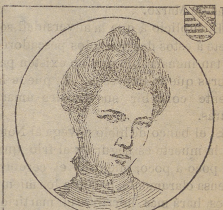
BEATRIZ DE SAJONIA