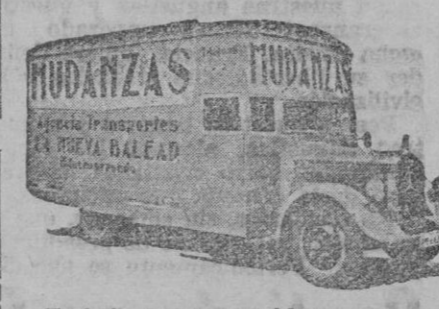
Embalajes de muebles. Guarda muebles económico. 7 Esquinas 13 Teléfono Lúm. 2227.