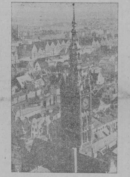
Vista de la ciudad de Danzig. En primer término, la torre del Ayuntamiento de la ciudad.

primas y alimento, para avituallamiento de la Gran Bretaña. EL «BREMEN» EN ISLANDIA Estoccolmo. — El gran trasatlántico alemán "Bremen" está en Islandia. Fondeó anteayer en el puerto de Reykiavik. Se le dió, apenas iniciada la guerra por capturado por un buque de guerra inglés. Luego se desmintió la noticia y se afirmó que el "Bremen" había llegado al puerto mejicano de Veracruz. Ahora se le da por llegado a puerto islandés, país autónomo con protectorado noruego.