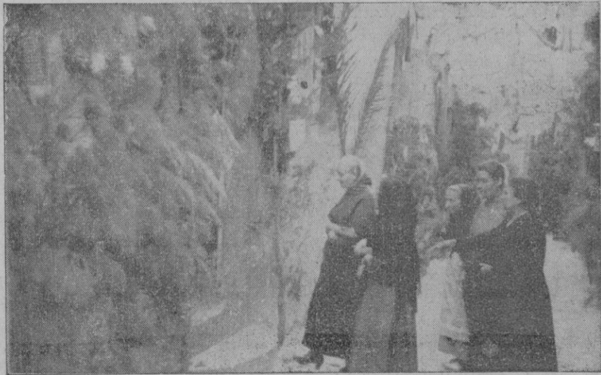
Grupo de mujeres entrando en la casa natal de la «Beateta» para orar breve rato ante la reliquia de la Santa

Organizada la comitiva, inició su marcha, la carroza triunfal. Iba en primer término, jinete en una mula, el personaje que representaba «el padre de la Beateta» con la antigua