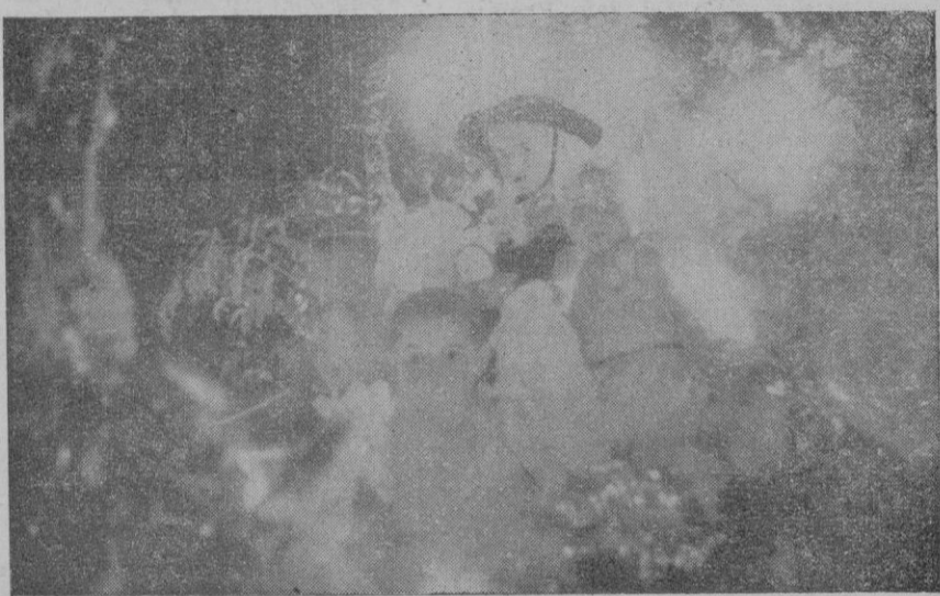
Un detalle de la carroza triunfal

Este —que mañana cruzará la ciudad— revestirá todo el esplendor y la brillantez, la dignidad y la justeza histórica que requiere