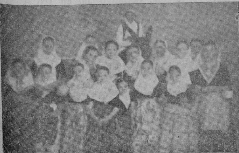
Un grupo de jóvenes payesas que seguían a la carroza triunfal

Será obligatoria la venta de lana a almacenistas y a cualquier industrial que la precisare para su correspondiente transformación.