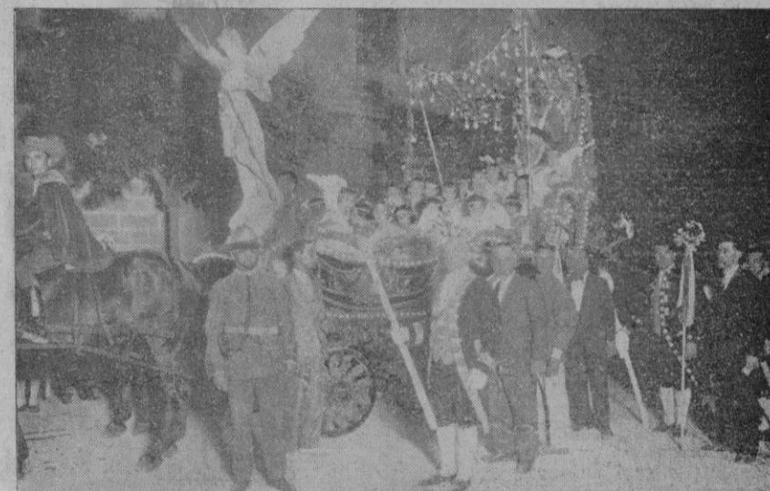
El «carro triunfal» que, en agosto de 1930, patrocinado por la Diputación Provincial, recorrió las calles y plazas de la ciudad

Como dijimos ya ayer, el «carro triunfal» saldrá mañana, domingo, de