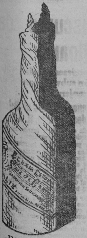
Ptas. 5'85 el frasco

Laboratorios SAIZ DE CARLOS, Dirección provisional: San Bartolomé, 1 - San Sebastián.