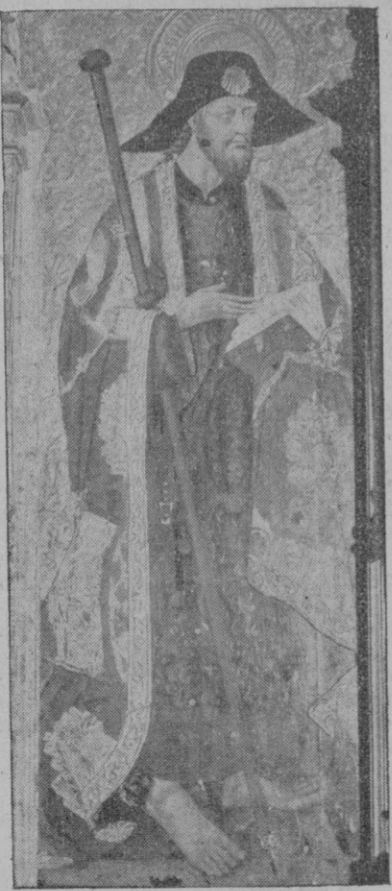
Santiago Apóstol, Patrón de España. — Pintura del siglo XIV perteneciente al tesoro artístico-religioso de Ibiza

Caso de fallecimiento del interesado a consecuencia de la guerra y antes de hacer efectivos los derechos que se le reconocen en el párrafo anterior, se entenderán transferidos al que ostentaba al percibo de los devengos de referencia al cónyuge que no haya tomado estado, a los hijos menores de edad y a los padres por este orden, y una vez acreditada su adhesión al Movimiento Nacional.