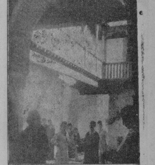
El patio de la Casa del Chapiz. He aquí, a grandes rasgos traza-

dos, lo que es la Escuela de Estudios Arabes de Granada. Si su pasado fué lucido, el porvenir que la aguarda, a juzgar por el presente, ha de revestir la mayor brillantez.