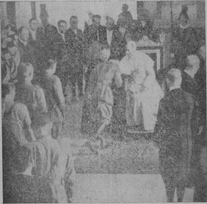
Los jefes de las fuerzas españolas prestan homenaje y acatamiento al Sumo Pontífice

Los 3.000 soldados españoles de nuestros batallones de "Flechas azules", en su estancia en Roma, estuvieron —mandados por sus jefes y acompañados de la misión política y naval—, que presidía el Ministro de la Gobernación, señor Serrano Suñer— en el Vaticano, para visitar, y prestar homenaje y acatamiento, a S. S. el Papa Pío XII. "Guardaré con emoción —dijo, en un discurso, el señor Serrano Suñer— el recuerdo de aquella escena impresionante de los 3.000 soldados de Franco entrando en el Vaticano, porque fueron los apóstoles armados de la fe". Merece destacar la trascendental deferencia del Pontífice a la España Católica de hoy, permitiendo la entrada en el Vaticano a los soldados españoles con sus armas, hecho que no se ha producido desde hace más de 200 años, siendo un grandísimo honor para estos soldados de Franco el haber sido los únicos que en recinto pontifical han sido admitidos con todo su armamento.