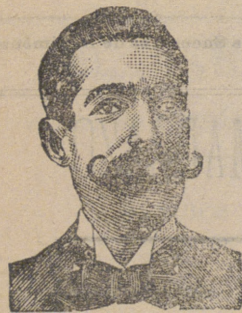
Costanzi, Diputación, 435, Barana.

ROOB ANTISIFILITICO INYECCION VEGETAL COSTANZI