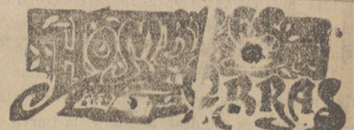
EL GENERAL QUESADA

Aunque en algunos casos los términos medios suelen dar excelentes resultados, no siempre son beneficiosos, porque pueden multiplicar los odios por convertir en enemigos á los propios partidarios. Esto le ocurrió al general D. Vicente Jenaro de Quesada, quien, siendo el favor de las ideas tradicionales, fué asesinado el 15 de Agosto de 1836 por los realistas, por suponerle amigo de los liberales, á consecuencia de oponerse á todo género de excesos y atropellos, ser magnánimo con sus enemigos políticos y salir siempre al paso de los realistas que ponían por pantalla á la política para dar satisfacción á sus apetitos de venganza ó á sus instintos criminales.