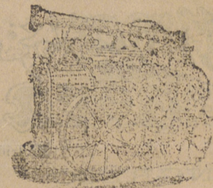
Máquina de vapor locomóvil.

Director: Laureano Navas Fuencarral, 141, Madrid.