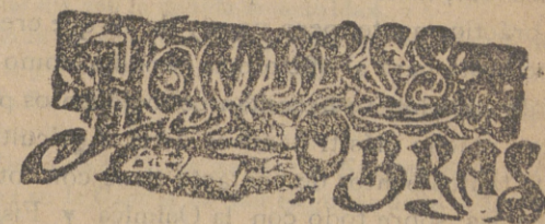
JUAN FRANCISCO BARBIERI

Los centenos y cebadas han mejorado algo vendiéndose los primeros á 30 y 1/2 reales fanega y á 26 y 27 las segundas.