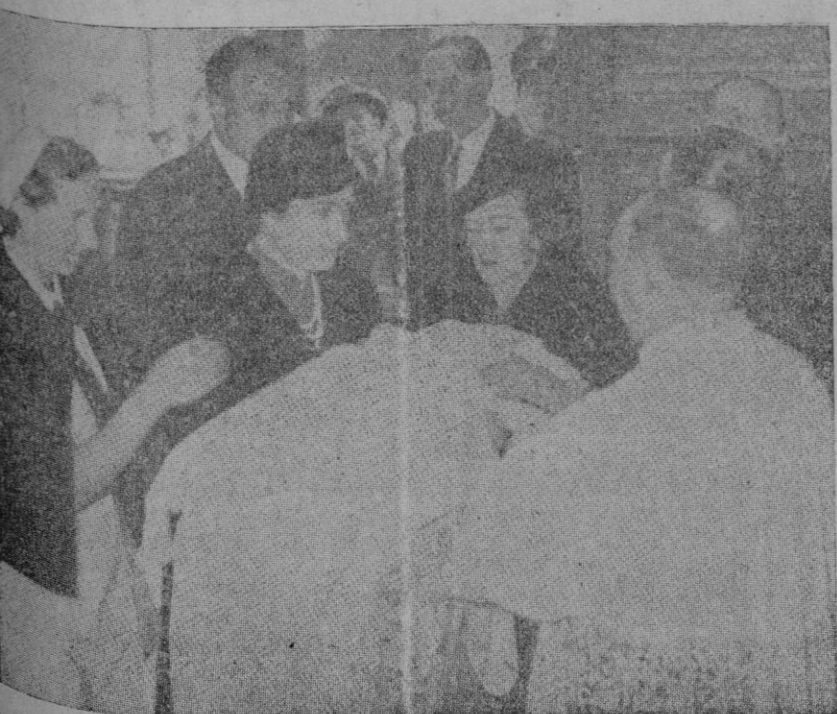
Roma. — Bautizo de la nueva hija, de Don Juan de Borbón y Battemberg y de Doña Mercedes de Borbón-Sicilia y Orleans

Dijo, únicamente, que era necesario revisar, en la próxima reunión