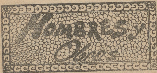
JUAN SEBASTIÁN ELCANO