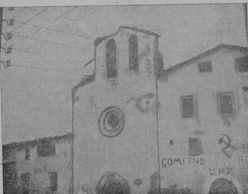
En la Cataluña liberada