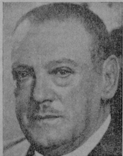
El ilustre general Excmo. Sr. D. Severiano Martínez Anido, Ministro de Orden Público, que acaba de fallecer en Valladolid

Y decimos nosotros: ¿Es que a la gente del pueblo, por falta de otras cosas, ya les dan algarobos? ¿Y cuántos años tardarán en coger las algarobas que ahora han sembrado?