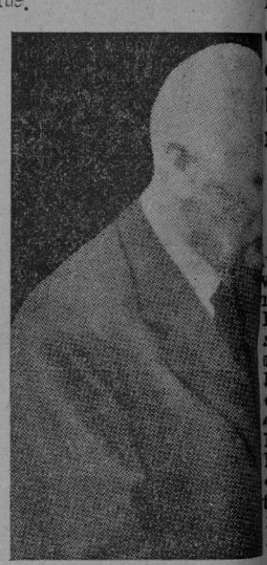
Don Carlos de Borbón

Sevilla. — Con motivo de la fiesta onomástica de Don Carlos de Borbón, fueron numerosas personas que desfilaron por donde se hospeda con objeto de darle.