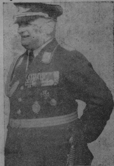
El Teniente Coronel Von Scheele Agregado del Aire de la Embajada alemana

Por cierto — añadió — que he tenido ocasión de comprobar el alto espíritu de vuestros combatientes y realmente he podido ver que los españoles, la juventud española que lucha encarnizadamente en los frentes es la que sabe más bellamente morir de todas. Para ella no hay obstáculos, ni riesgos, ni peligros. Llegar siempre donde tiene que llegar, sin dar im-