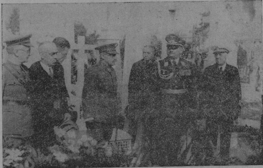
El representante de las fuerzas armadas de Alemania con nuestras autoridades.

de haber prestado atención entre la saña de un lado y la antipatía del otro. Que esa sangre vertida me perdone la parte