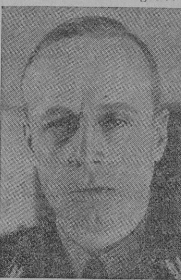
El Barón von Ribbentrop

trangeros italiano, Conde Ciano; el Secretario del Partido fascista, Starace; el Ministro de la Cultura Popular, Alfieri, juntamente con los Subsecretarios de la Presidencia y de Negocios Extranjeros; el Gobernador de Roma, el Prefecto y el Secretario Federal.