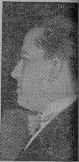
El Conde Ciano

Seguidamente el Barón von Ribbentrop y sus acompañantes se dirigieron en automóvil, al hotel donde se hospedaban.