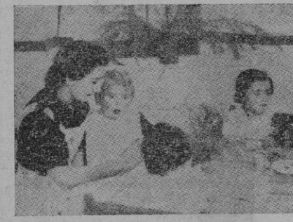
...en los “comedores infantiles”, con amor y cariño se cuida a los chiquillos ríalmente, con espléndida generosidad.

Y conocer y amar al “Auxilio” es apoyarlo con cariño, moral y mate-