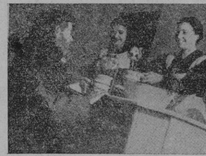
...comida caliente y sabrosa en las “cocinas de hermandad”

En las ciudades y villas de la España blanca, en las que no supieron del dolor de la dominación roja y en las que la horda dejó su huella de desolación y tristeza, “Auxilio Social” ha extendido su maravillosa organización, repartiendo a manos llenas sus hogares - comedores, cocinas, guarderías, policlínicas, dispensarios, roperos, etc. — que llevan a las gen-