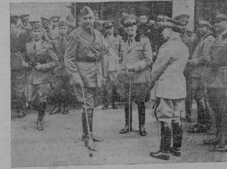
El general Berti, Comandante-jefe del cuerpo legionario italiano, en el momento de desembarcar anteayer en el puerto de Nápoles

Si alguna esperanza se desprende de los acontecimientos recientemente presenciados en Europa, es la lección realista de que no cabe ya intentar la curación de los males con paliativos ni emplastos, sino aplicación de supremos revulsivos de la energía del valor y de la sinceridad, únicos que tienen la virtud de abrir pa-