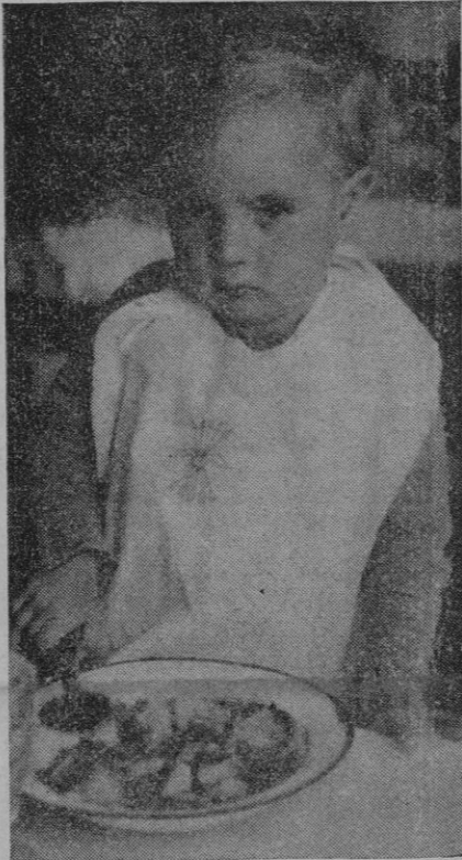
...y las lágrimas infantiles se trocaran en dulces sonrisas...

El Estado nuevo, el de la mano abierta con gesto de cordialidad y comprensión, debía, si en verdad era su deseo acabar para siempre con los