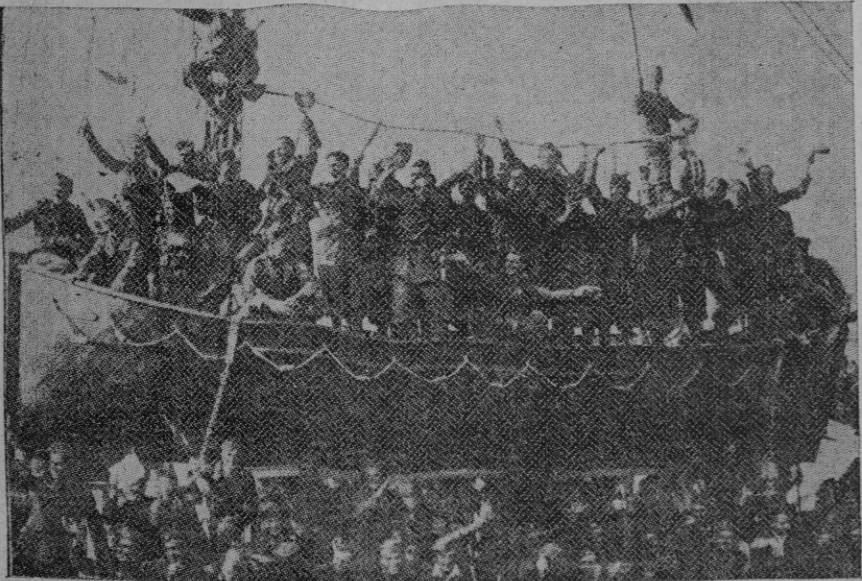
A bordo del trasatlántico "Cerdeña", uno de los cuatro buques en que han regresado a Italia los heroicos legionarios, poco antes de llegar anteayer a Nápoles

El llamamiento, en fin, que nos hace actualmente la Iglesia para acudir en favor de las misiones es idéntico al que en sus cartas hacía a los cristianos primitivos el Apóstol de las gentes, el cual tuvo para la caridad misional nombres y frases tan hermosas como estas: "vuestra gracia", "olor de santidad", "ofrenda agradable a Dios".