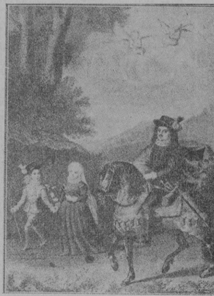
Santa Teresa y su hermano Rodrigo, detenidos por orden de su padre, cuando salían para tierra de moros

Por eso bien puede decirse de ella que es una mujer de nuestros días.