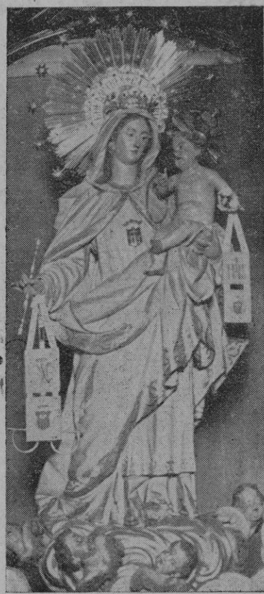
¡Oh Virgen Redentora! Mira hoy a los hijos tuyos de la España marxista. Sé para ellos lo que fuiste para los del Alcázar: su libertadora

Tenía razón el avisado periodista del diario de Toulouse y el Napoleón toledano, José García. Y digo que tenían razón, porque el periódico vino a ser el pan espiritual de los sitiados, el maná milagroso que les nutría el corazón con ese alimento que él solo puede comer y que en este caso solo tenía un plato único: la dignidad de la Patria puesta bajo su guarda entre los muros sagrados del Alcázar. Pero al marxismo materialista le hubiera parecido más útil unos cuantos sacos de patatas, y al no contar con esos sacos, para ellos todo estaba perdido. Ya podían tirar ejemplares