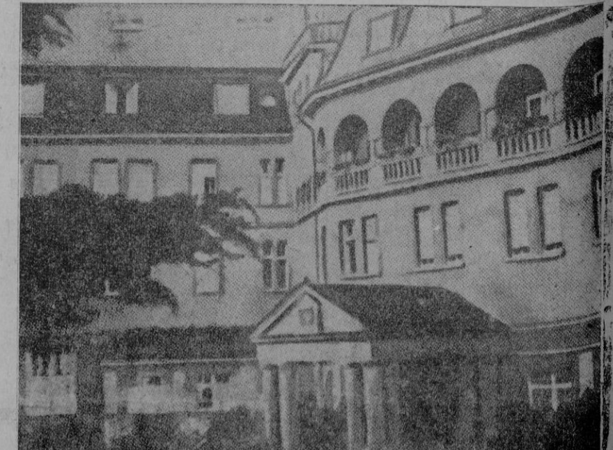
«Hotel Petersberg», a la izquierda del Rin, donde se alojó Chamberlain con motivo de sus conversaciones con Hitler