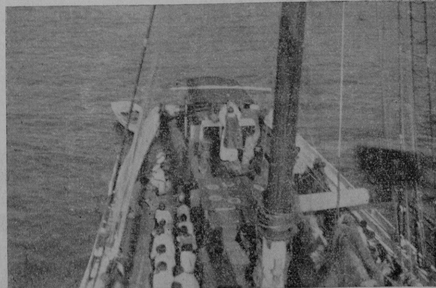
Misa a bordo del "San Bernardo"

El remedio a los cuadros de miseria que el periodista inglés, como tantos otros, no pueden por menos de pintar con tintas sombrías, se cifra en algo que no puede ser más sencillo. Se cifra en una sola palabra muy breve, pero luminosa; la palabra PAZ. Donde Franco la hace reinar, todos logran el pan, la justicia y la alegría.