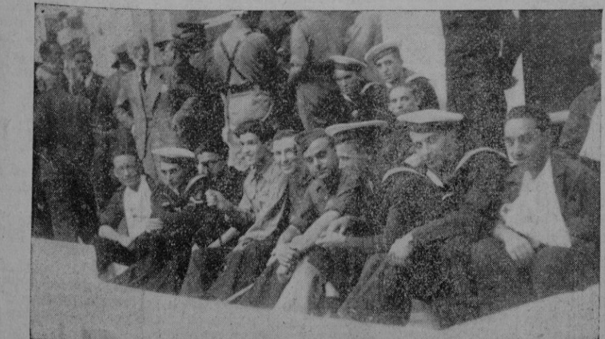
DE LA MANIFESTACION DEL MARTES

Yo no me podía marchar a España sin pasar antes, siquiera fuese por