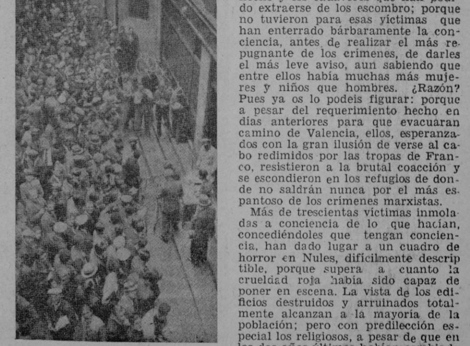
París. — Salida de los corredores para tomar parte en la Vuelta a Francia en bicicleta. (Continúa al final de la primera columna de la segunda página)

órdenes sobre la preparación de una línea de defensa. Se dice, a propósito de esta accidentada reunión, que el Comisario general, Hernández, ha pedido a Negrín que destituya a Miaja por incapacidad y por sospechoso de negligencia.